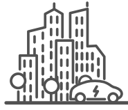
Komplett infrastruktur for lading av elbil